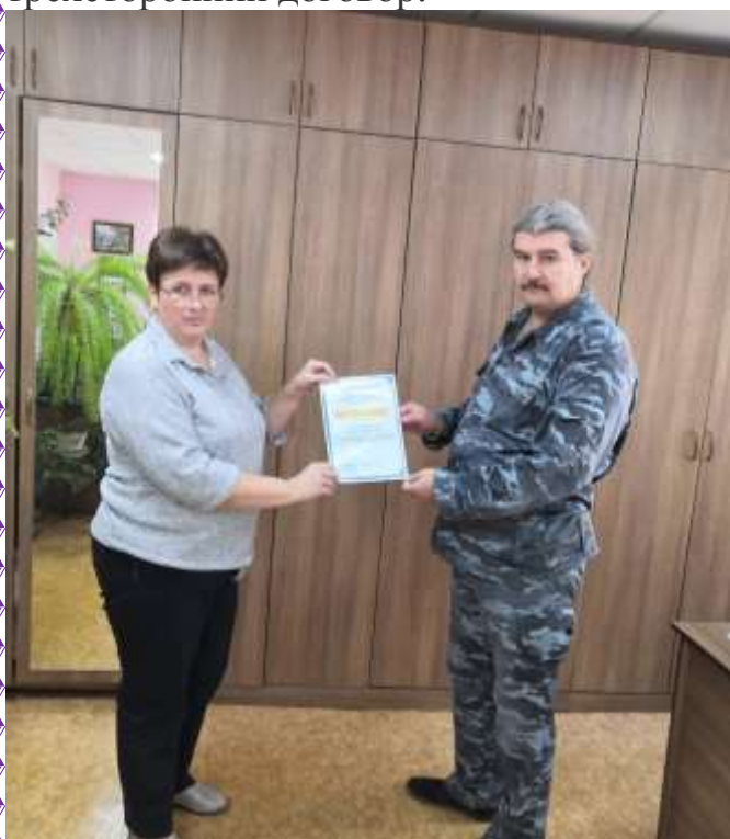
Встреча с ветеранами труда