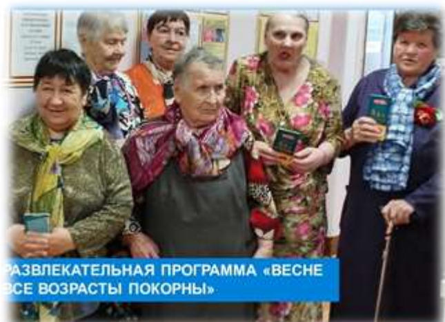
РАЗВЛЕКАТЕЛЬНАЯ ПРОГРАММА «ВЕСНЕ ВСЕ ВОЗРАСТЫ ПОКОРНЫ!»